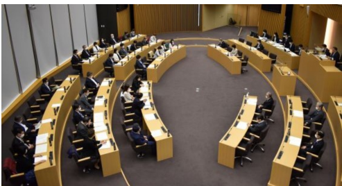
区議会議場 区議会ホームページより

公約実現、区民の暮らし、福祉を守るために日本共産党区議団は全力で今議会にも臨みます。みなさんの区議会傍聴をお願いします。この議会で請願・陳情が継続審査になりますと、審議未了、廃案になります。